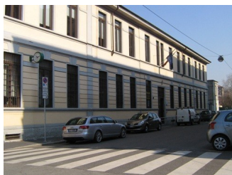
Scuola Primaria di via Monte Piana