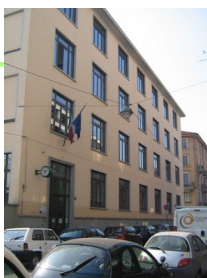
Scuola Secondaria di primo grado di via Monte Popera