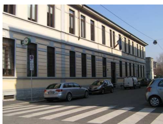
Scuola Primaria di via Monte Piana