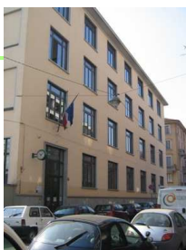
Scuola Secondaria di primo grado di via Monte Popera