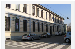
Scuola Primaria di Via Monte Piana